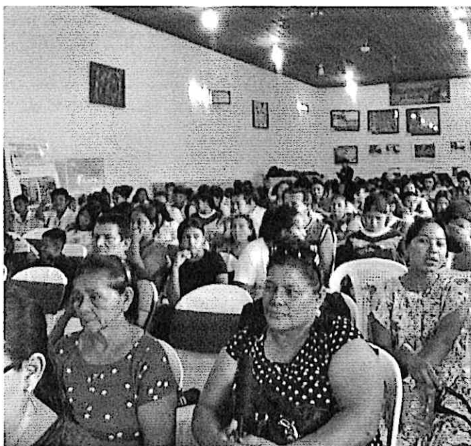
Público disfrutando del concierto en el centro cultural de Mazatenango