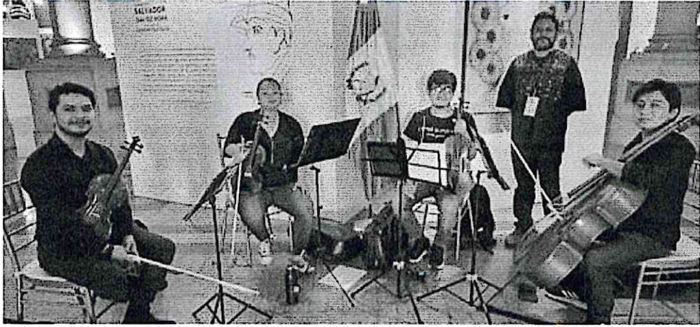
Cuarteto primavera en el Palacio Nacional