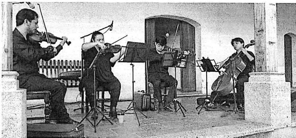
Cuarteto Primavera durante la presentación

El evento contó con la presencia de representantes de la municipalidad de San Pedro Pinula y directores de distintas áreas del Ministerio de Cultura y Deportes. La Marimba de Concierto del Palacio Nacional de la Cultura acompañó la velada, atrayendo a una numerosa audiencia, en particular personas de la tercera edad, quienes disfrutaron especialmente de las melodías populares, con especial atención a las obras nacionales.