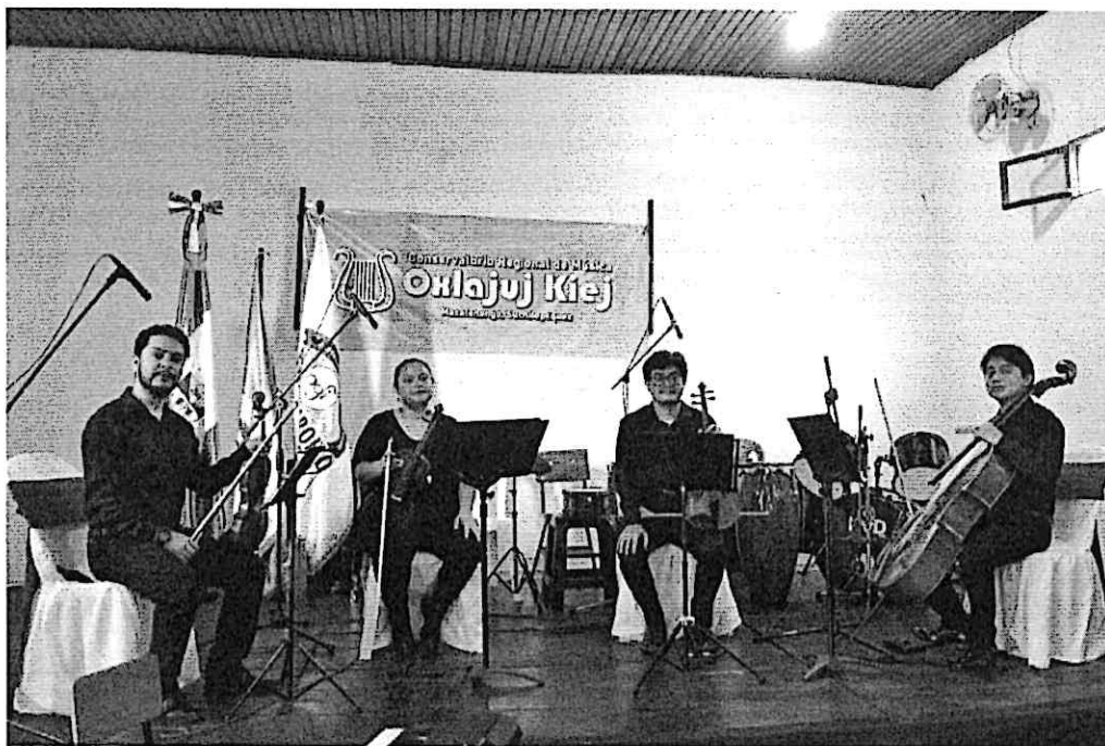
Cuarteto Primavera durante el concierto

Los talleres tuvieron lugar de 2:00 a 4:00 p.m., seguidos por el concierto a las 4:30 p.m., ambos realizados en el Centro Cultural de Mazatenango. El público disfrutó del programa, reconociendo con agrado las obras latinoamericanas y nacionales, y mostrando un particular interés por las piezas centroeuropeas y la colaboración entre los estudiantes y el cuarteto. Los alumnos se mostraron muy comprometidos durante los talleres, destacando su entusiasmo por perfeccionar su técnica y mejorar su ejecución instrumental.