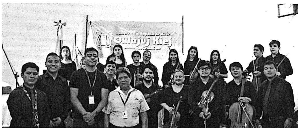
Maestros y estudiantes del Conservatorio Regional de Música "Oxlajuj Kiej" de Suchitepéquez con el Cuarteto Primavera.