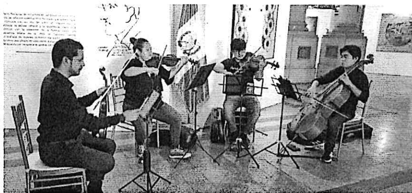
Cuarteto Primavera ensayando