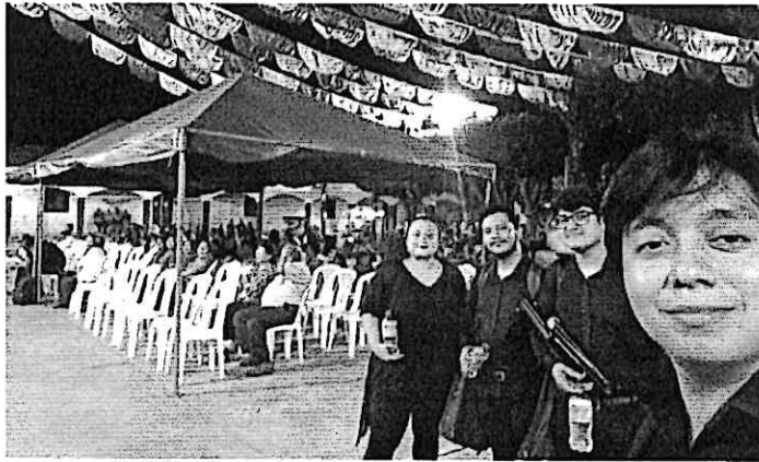
Cuarteto Primavera y el publico